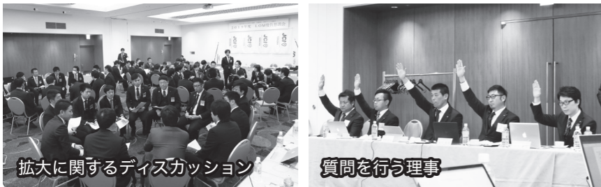
拡大に関するディスカッション