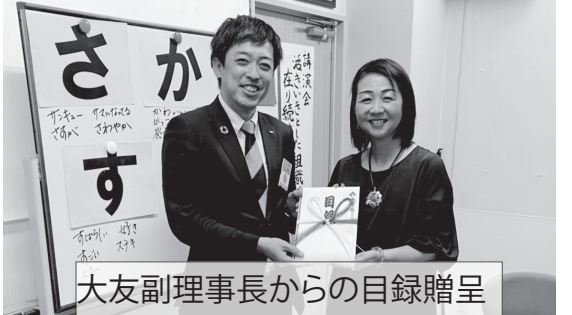
大友副理事長からの目録贈呈