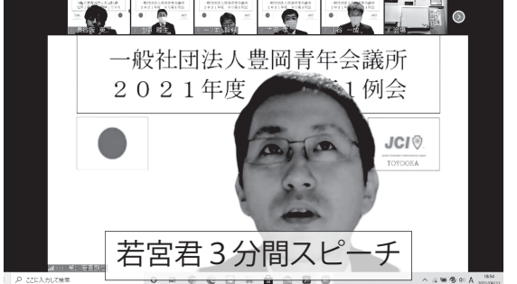
若宮君3分間スピーチ