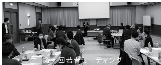
第1回若者ミーティング

2月17日に、60周年特別事業に向けた、第1回若者ミーティングが開催され、豊岡在住・在勤の20～30代の若者21名にご参加いただきました。60周年特別事業としてフェスを企画している主旨・目的を理解していただき、そのうえで、どうやったら盛り上がるか、どんな準備が必要かなどを、グループワークという形で意見を出しあっていただきました。参加して下さった若者の皆様からは、豊岡の未来への熱い思い、そして何か力になりたいという強い意志をひしひしと感じ、我々青年会議所メンバーも身の引き締まる想いで、意見交換させていただきました。豊岡で活躍する若者たちの熱い想いを最高の形で実現させるべく、これからの事業構築に臨んでまいります。