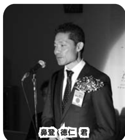
鼻登 徳仁 君