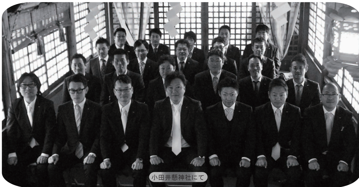
小田井懸神社にて