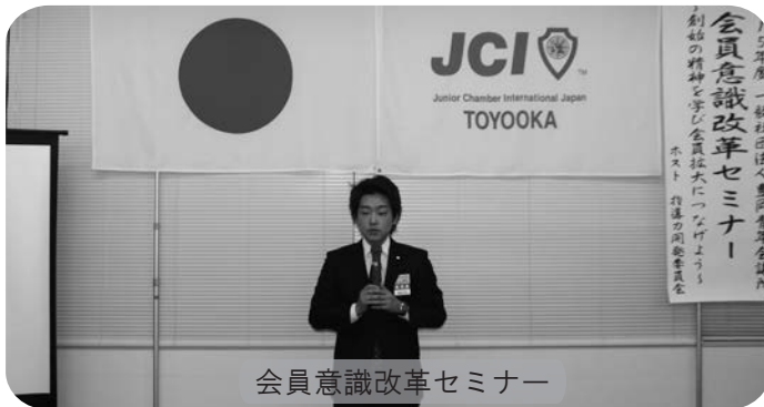
会員意識改革セミナー