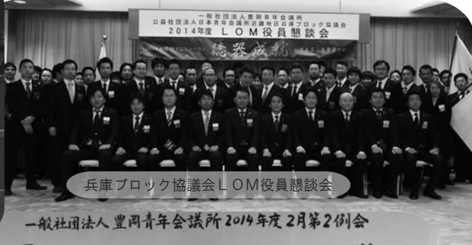
兵庫ブロック協議会LOM役員懇談会