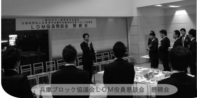
兵庫ブロック協議会LOM役員懇談会 懇親会