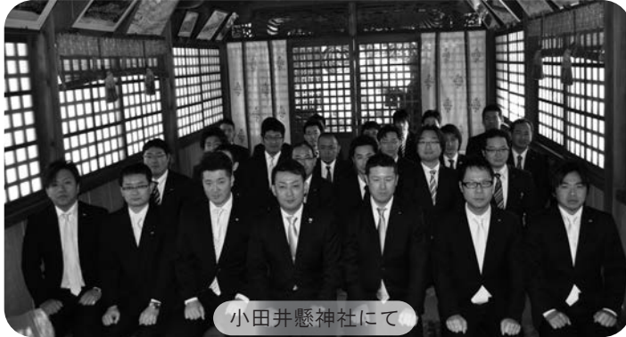
小田井懸神社にて