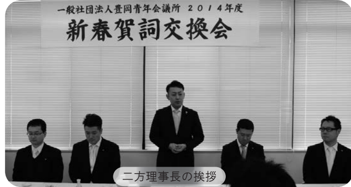
二方理事長の挨拶